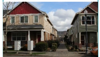
Above: Rowhouses In Fairview Above, Left: Salish Ponds Cottage Cluster in Fairview

durham-oregon.us/2022/01/middle-housing-public-information-sessions/