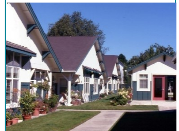
Above: Duplex Cluster In Sheridan Below: Triplex In Salem