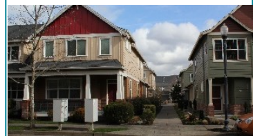
Arriba: Vivienda Adosad En Fairview Arriba, Izquierda: Grupo De Cabañas Salish Ponds En Fairview

durham-oregon.us/2022/01/middle-housing-public-information-sessions/