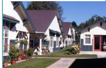
Arriba: Dúplex En Sheridan Abajo: Cuádruplex En Salem